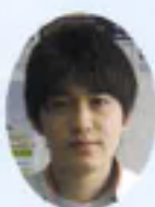
早稲田大学 教育学部合格

個人教育会は、不登校に悩む生徒を専門に対応する「教育サポート高等学院」を開校している。九州の名門「神村学園高等部」と提携し、「全日制」と交わらない高校卒業資格取得が可能だ。さらに、大学受験への進学指導も本格的に行う。集団授業ではなく、やはり1対1の指導を実施し、週1回から、自宅でも受講可能だ。「難関大学を目指している方」「集団生活になじめない方」「心が壊れている方」「発達障がいを抱えている方」に適している。毎年、高校に通えなくなった学生を有名・難関大学へ合格させている実績が評判だ。今年は早稲田大学、京都医療科学大学等に合格を果たしている。